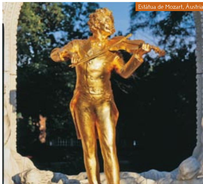
Estátua de Mozart, Áustria

Café da manhã. Início de um pequeno passeio, pela Lagoa de Veneza, até chegar à Praça de São Marcos onde faremos um tour de